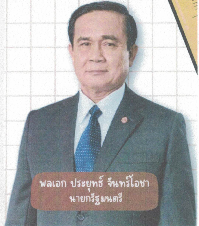
พลเอก ประยุทธ์ จันทร์โอชา นายกรัฐมนตรี