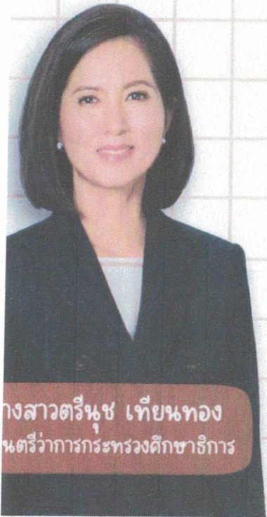
นางสาวตรีหุช เทียนทอง รัฐมนตรีว่าการกระทรวงศึกษาธิการ